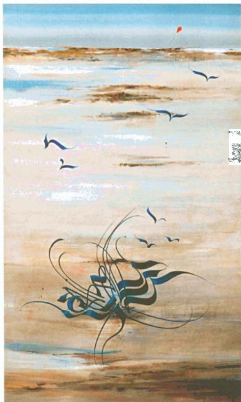
L'estran, huile sur toile