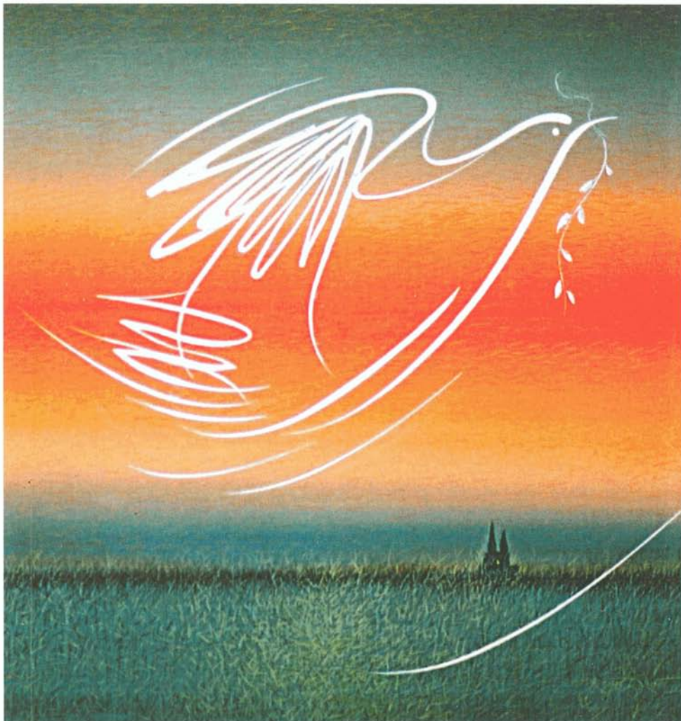
Chartres, Péguy, huile sur toile, 2006