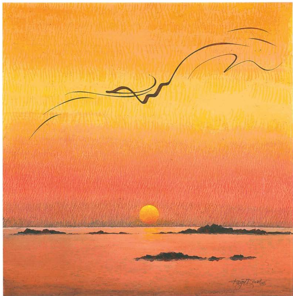
Coucher de soleil, huile sur toile, 80x80