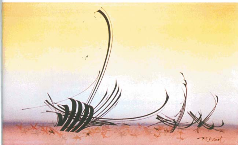
Composition, huile sur toile